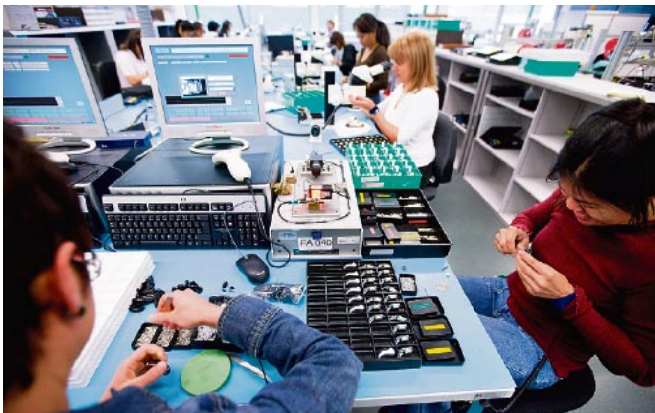
Für Arbeitnehmer sind die Aussichten überraschend gut. Die Befürchtungen der Konjunkturforscher haben sich nicht bewahrheitet.